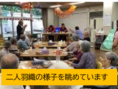
二人羽織の様子を眺めています

9月15日に敬老会を行いました。乾杯から始まり、皆さんで元気が出るように365歩のマーチを歌いました♪利用者さん一人一人に感謝状を贈った時には少し感動していたようです。余興も大変盛り上がり楽しい時間を過ごしました。