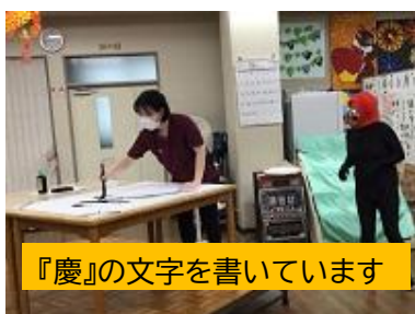
『慶』の文字を書いています