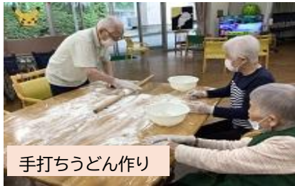
手打ちうどん作り