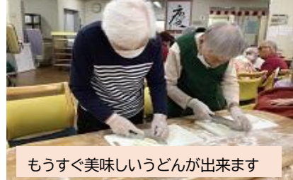
もうすぐ美味しいうどんが出来ます