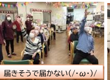
届きそうで届かない(/・ω・)/