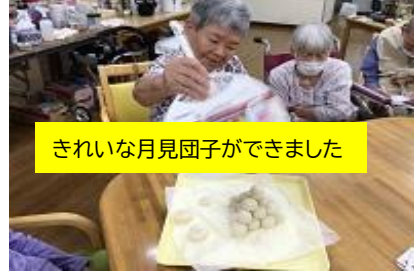
きれいな月見団子ができました