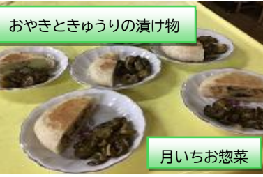
おやきときゅうりの漬け物