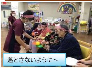
落とさないように～