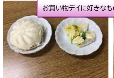
お買い物デイに好きなものをおやつに買いました