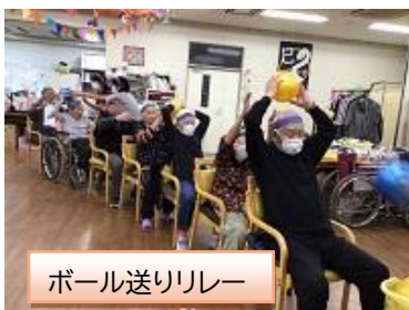
ボール送りリレー