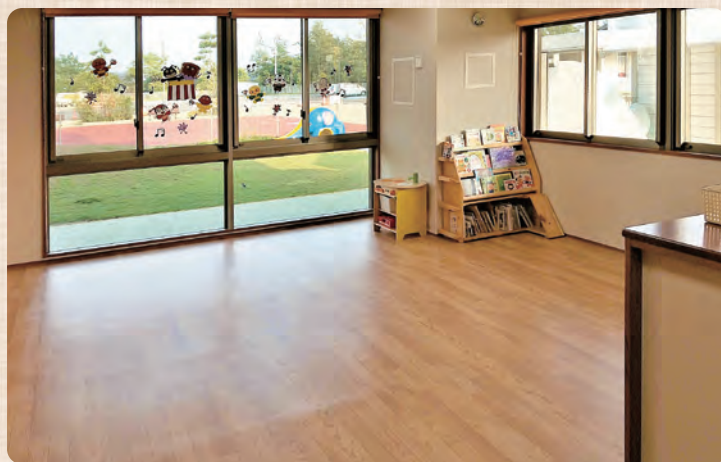
ひまわり保育ルーム