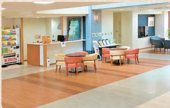
地域交流スペース

地域交流スペースや事業所内保育室（定員12名、従業員枠8名、地域枠4名）を設置し、地域との連携を図るとともに、地域包括支援センターを拠点とした地域包括ケアシステムにも貢献しています。