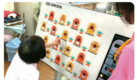
ゲームで集中力を高めます