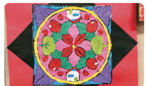
ご利用者様の作品（コヨリによる貼り絵）