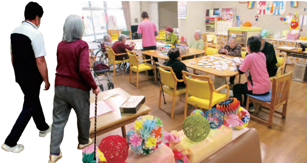
歩行は健康管理の基本です