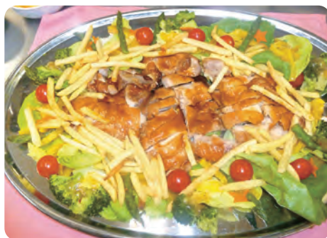
旬の素材で、栄養バランスが考えられたお食事