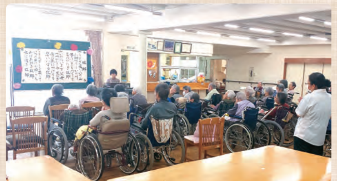
ボランティアの指揮のもと、童謡歌を合唱します