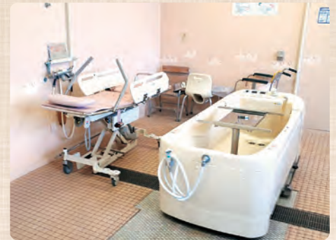
どなたでも安心して入浴可能な浴室