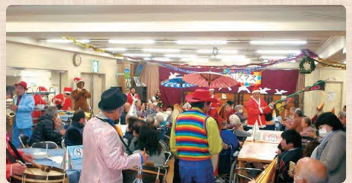
チンドンも参加して盛大に行われるクリスマス会