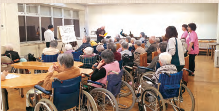
ハーモニカによる懐かしい楽曲の演奏