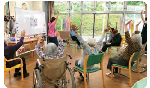
生活機能向上のための体操