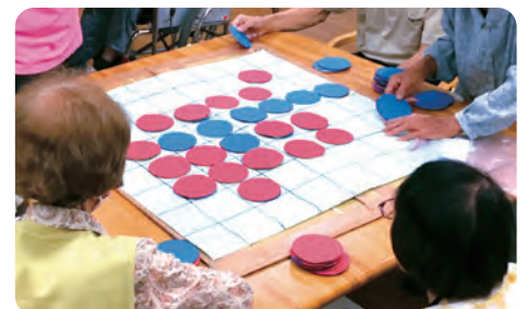
楽しみながらのコミュニケーション