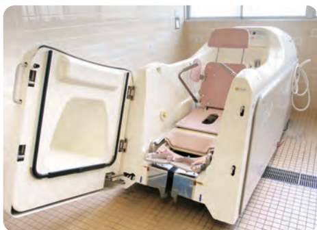
車椅子の方でも入れる特殊浴槽