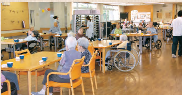
談笑を交えた楽しい食事の時間